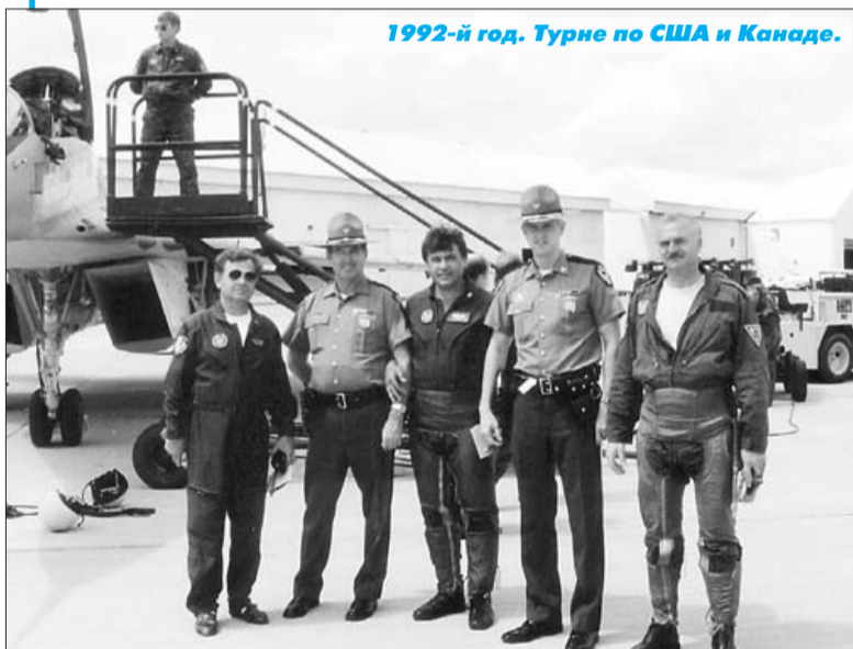
1992-й год. Турне по США и Канаде.

За время своего существования группа получила чрезвычайную популярность не только у нас, но и за границей. Её уникальность состояла в том, что на серийных боевых самолётах в мире тогда выступало всего 5 пилотажных групп: 2 – в США, 2 – в России и наши “Украинские соколы”. Другие пилотажные группы использовали лёгкие учебно-тренировочные самолёты. Благодаря высокому мастерству и высокому уровню лётной подготовки всех лётчиков-испытателей, количество тренировочных полётов эскадрильи было значительно меньше в сравнении с аналогичными зарубежными группами. При этом зре-